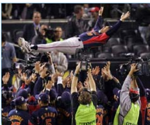
Haben allen Grund zum Feiern: Der japanische Team Manager Sadaharu Oh und seine siegreiche Mannschaft

Auch finanziell konnte die erstmalige Austragung der World Baseball Classic überzeugen. Prominente Partner wie MasterCard oder der japanische Softwarehersteller Konami zum einen, sowie die vor allem in Nord- und Lateinamerika reißenden Absatz findenden Merchandisingartikel zum anderen, trugen ihren Teil zum hervorragenden Abschlussergebnis der WBC bei. Das Ziel, eine ausgeglichene Bilanz zu präsentieren, wurde mit dem erzielten Reingewinn von knapp 15 Millionen Dollar jedenfalls deutlich übertroffen.