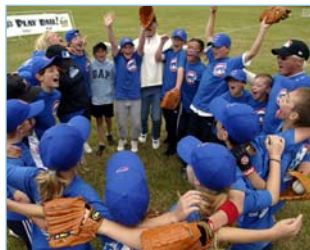
Ab sofort ist bei Deutschlands Schulkindern wieder Baseball angesagt

In Köln ebenfalls vor Ort wird der neue Play Ball! Partner New Era Cap sein. Der weltbekannte Her-