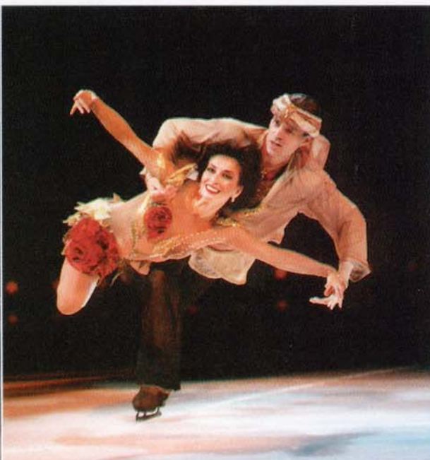
Mit zwei neuen Nummern wird der französische Eis-Comedymeister Laurent Tobel (links) die Lachmuskeln der Besucher strapazieren. Kommen werden auch die Europa- und Weltmeister sowie Olympiasieger Maya Usova und Evgeny Platov aus Russland (rechts).